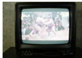
アナログ ブラウン管テレビ