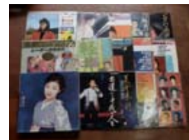
レーザーディスク