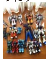
プラモジャンク 完成品