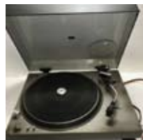
レコードプレーヤー ジャンク