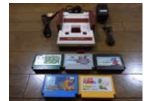
ファミコン本体 ソフト付き