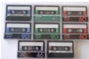
中古カセットテープ (録音済)