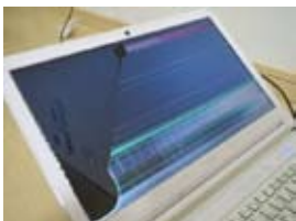
液晶の割れたノートPC