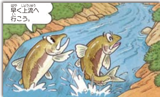
③川をさがしあてると、上流へとさかのぼります。