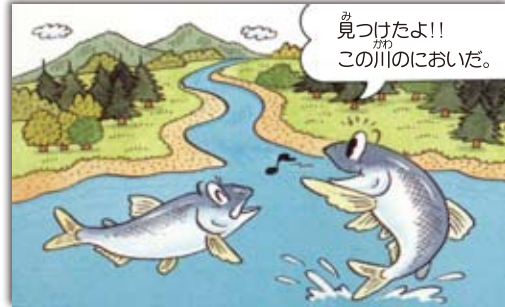
②サケは自分が生まれた川のおいさを、おぼえているのです。