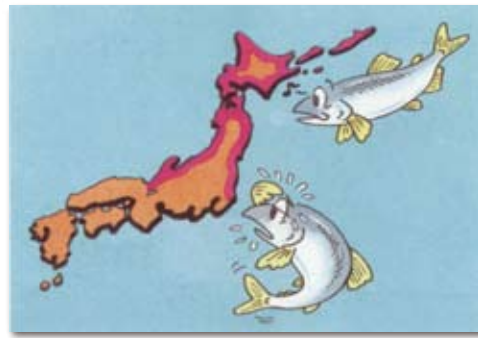
サケが帰ってくる地方。