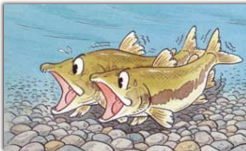
④川をさかのぼったサケは、たまごを川底にうみつけます。